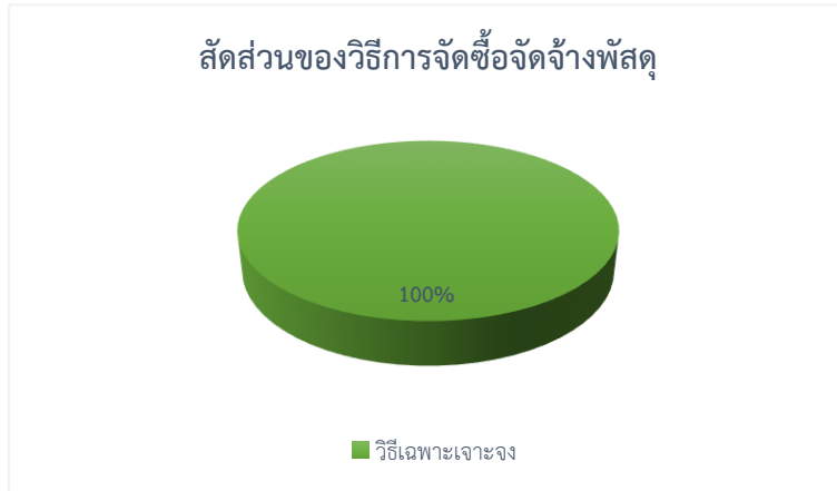
ภาพที่ 1 ร้อยละของวิธีการจัดซื้อจัดจ้างพัสดุ ประจำปีงบประมาณ พ.ศ. 2565